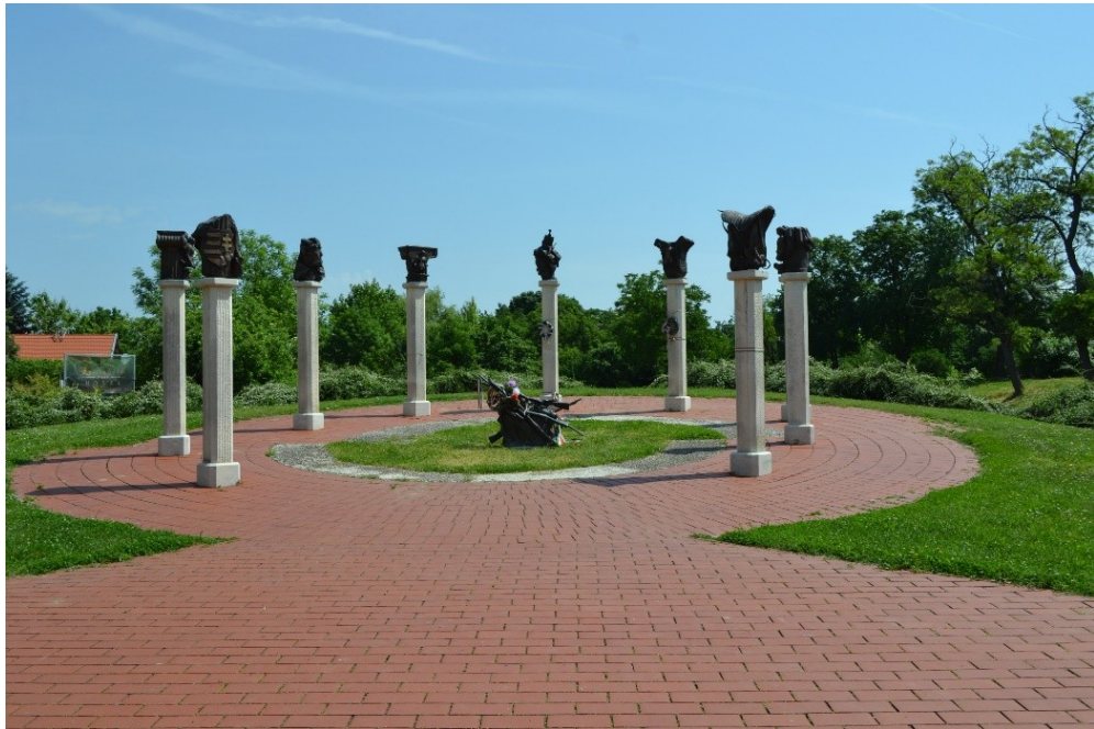
A gyulai 48-as tér és néhány részlete