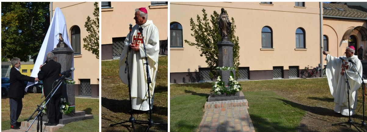
Sándoral leleplezzük a szobort. Püspök úr megtekinti, majd rövid beszéde után fölszenteli