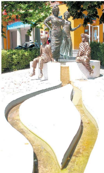
A Szent Erzsébet Mórachalmi Gyógyfürdő előtti kút.

Csongrád megyében két díszkútja készül el az idén Kligl Sándornak. Ezekről a funkcionális térdíszekről elmondta, szép feladatnak tartja őket, ugyanakkor több baja is van velük: fél évig nem látványosak, hiszen az időjárás miatt vízteleníteni kell, a másik a brutális rongálás, aminek áldozatul esnek. A napokban fejezte be a Szent Erzsébet Mórachalmi