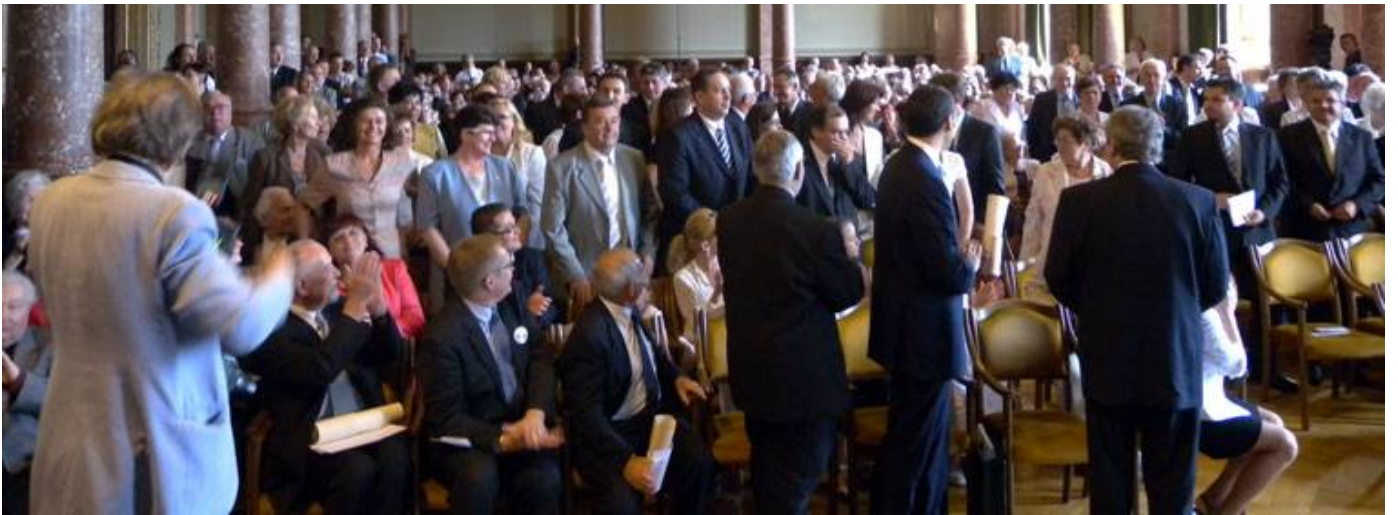
A Hódmezővásárhelyről érkezett több, mint 100 vendéget köszöntik a magyar Tudományos Akadémia dísztermében, a Magyar Örökség díjátadó ünnepségén.