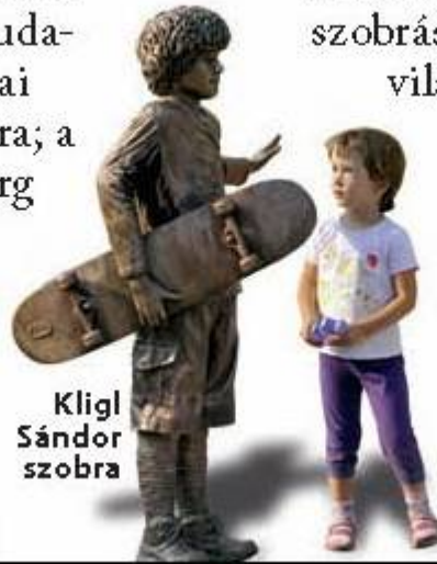
Klígl Sándor szobra

Újabb hét kitüntetettnek ítelték oda a Magyar Örökség Díjat, így a hétvégén Erkel Ferenc életműve és az általa alapított Budapesti Filharmóniai Társaság Zenekara; a németországi Burg Kastl Magyar Gimnázium fél évszázados nevelő tevékenysége; Hódmezővásárhely kultúraőrő